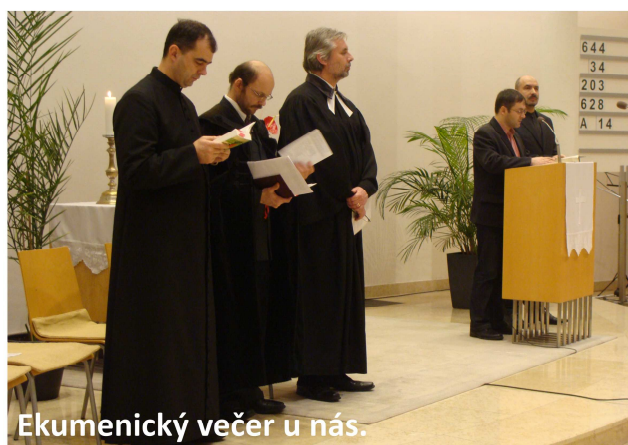
Ekumenický večer u nás.