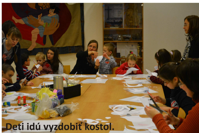
Deti idú vyzdobiť kostol.