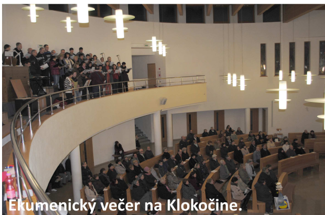
Ekumenický večer na Klokočine.