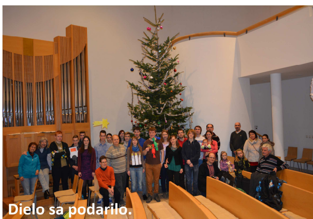
Dielo sa podarilo.