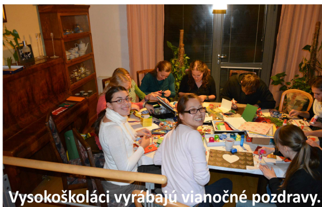
Vysokoškóoláci vyrábajú vianočné pozdravy.