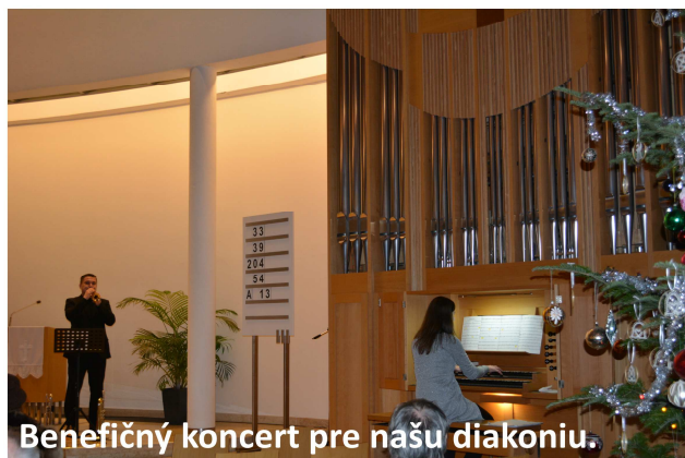
Benefičný koncert pre našu diakoniu.