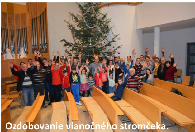
Ozdobovanie vianočného stromčeka.