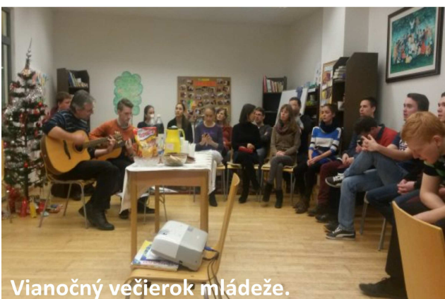
Vianočný večierok mládeže.