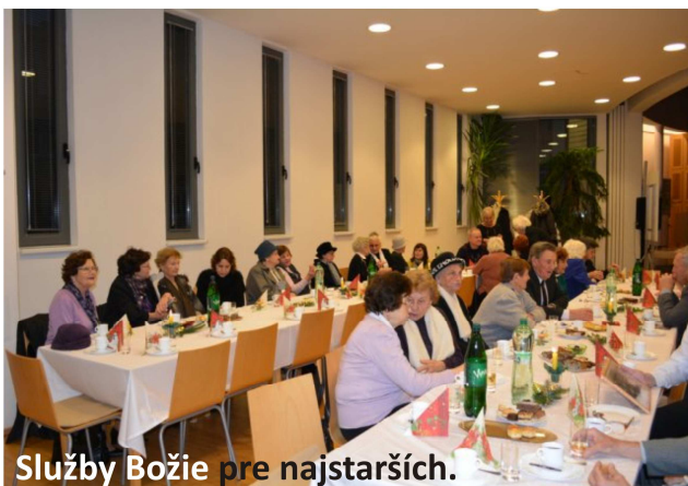
Služby Božie pre najstarších.