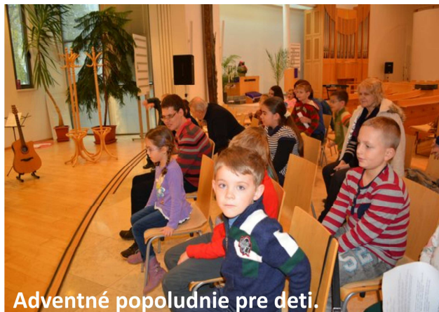
Adventné popoludnie pre deti.