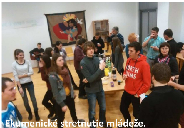
Ekumenické stretnutie mládeže.