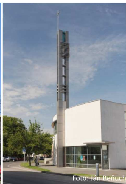
Vľavo: kostol v Žiline, vpravo: kostol v Nitre.

kolesa" hľadať, ako sa podobný problém podarilo vyriešiť iným.