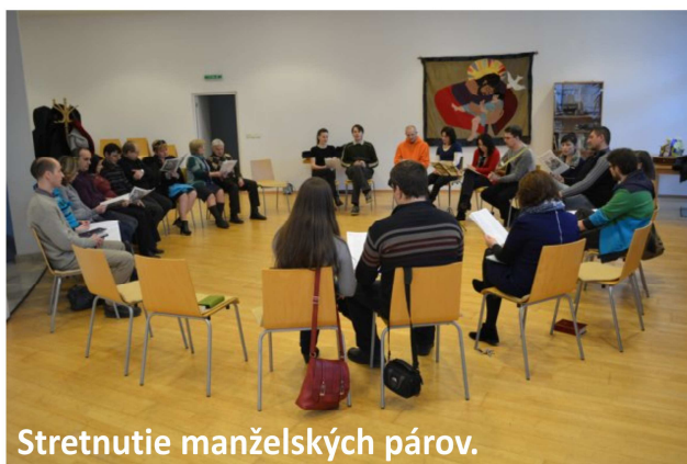
Stretnutie manželských párov.