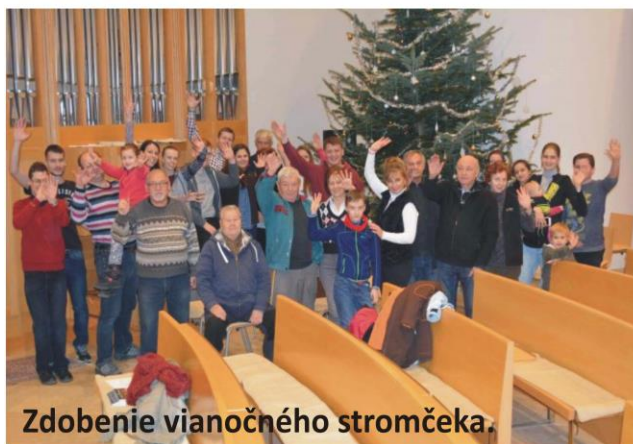
Zdobenie vianočného stromčeka.