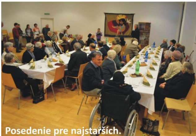
Posedenie pre najstarších.