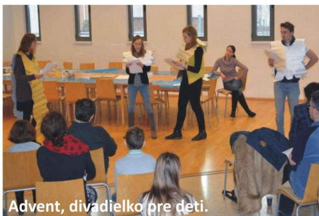
Advent, divadielko pre deti.