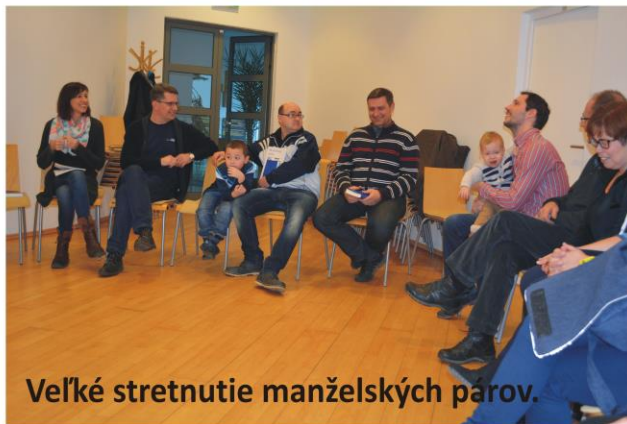
Veľké stretnutie manželských párov.