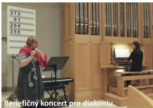
Benefičný koncert pre diakoniu.