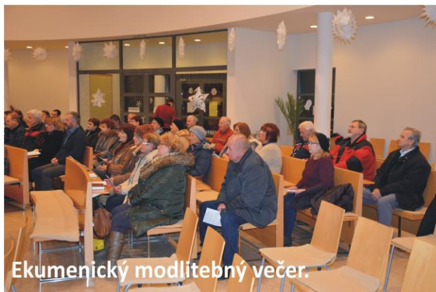
Ekumenický modlitebný večer.