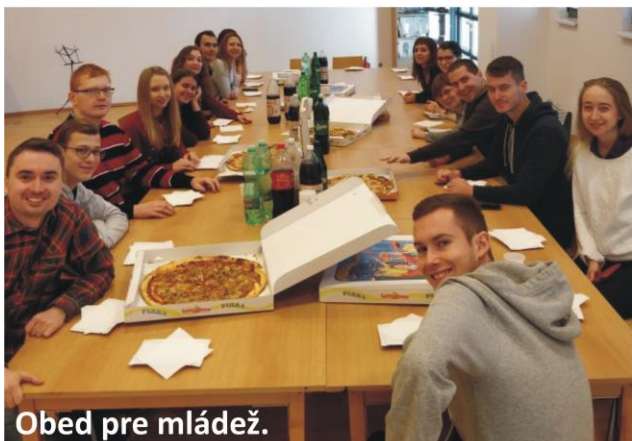
Obed pre mládež.