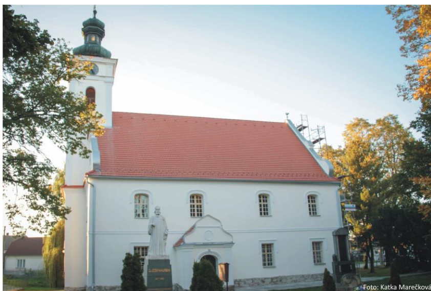
Hlboké, príklad klasickej architektúry tolerančného kostola, s neskôr pristavanou vežou.

rými evanjelickému cirkevnému školstvu vychádza v ústrety. Podstatu svojich reforiem však ponecháva nezmenenú. Evanjelické školstvo je vo zvláštnej situácii: Na jednej strane musí trpieť citelné zásahy cisárskej štátnej moci do svojej autonómie, na druhej strane vzniká veľmi veľa nových škôl a niektoré tradičné, zrušené, opäť vznikajú (napr. Evanjelické kolégium v Prešove).