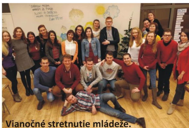
Vianočné stretnutie mládeže.