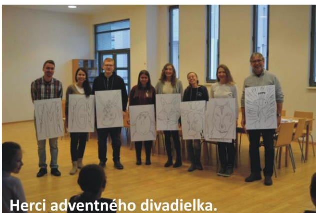
Herci adventného divadielka.