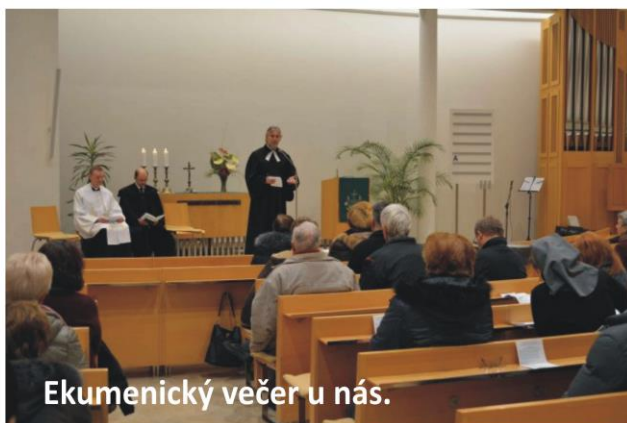
Ekumenický večer u nás.