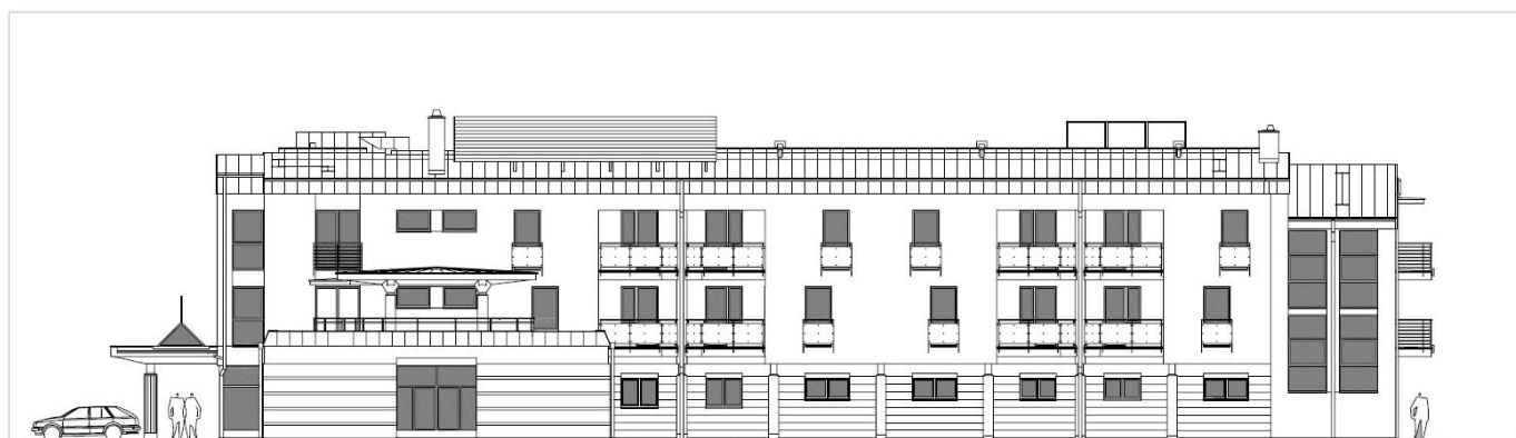
POHL'AD SV OD BRATISLAVSKEJ UL. M=1:200

Lavičky sú situované tak, aby poskytli klientom viaceré možnosti pobytu – buď na slnku, v tieni stromov, alebo v chránenom podlubí pod loggiami severozápadnej fasády objektu. Centrálna trávnatá plocha poslúži na petang, piknik v tráve, cvičenie, opaľovanie a pod. Vzrastlá živá jedľa, situovaná v kompozičnej osi spoločenskej časti / jedáleň, kaplnka, stacionár/ vedľa hlavnej záhradnej terasy, poslúži každoročne počas vianočných sviatkov ako sviatočne vyzdobený a osvetlený vianočný strom, ktorý bude každoročne s klientmi dozrievať.