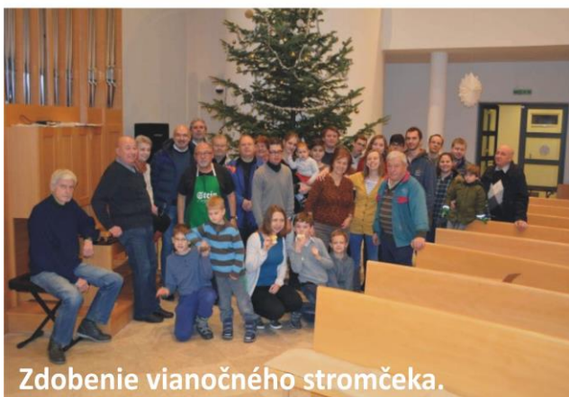
Zdobenie vianočného stromčeka.