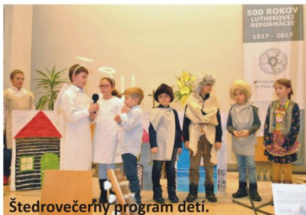
Štedrovečerný program detí.