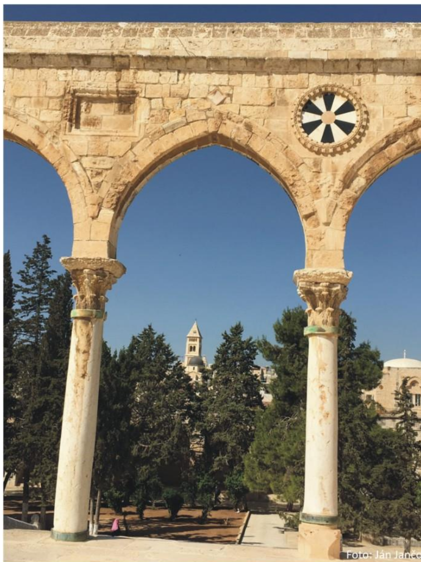
Cez pozostatok z Chrámu Šalamúnovho pohľad na Evanjelický kostol v Jeruzaleme.

Archeologické pamiatky – pri vzniku štátu Ben Gurion deklaroval, že umožnia všetkým serióznym archeológom možnosť skúmania lokalít, ktoré sú zaujímavé a dôležité. V roku 1947 bol urobený najväčší archeologický nález 20. storočia v Kumrane, kde boli nájdené zvitky Starej zmluvy, ktoré sa datujú do obdobia 70 rokov pred Kristom a 70 po Kristu. Význam tohto objavu je zvýraznením osobitného múzea Knihy, kde sú uložené zvitky a tiež