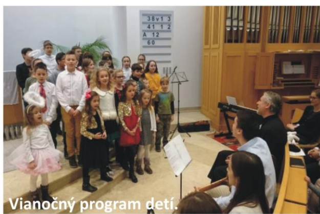
Vianočný program detí.