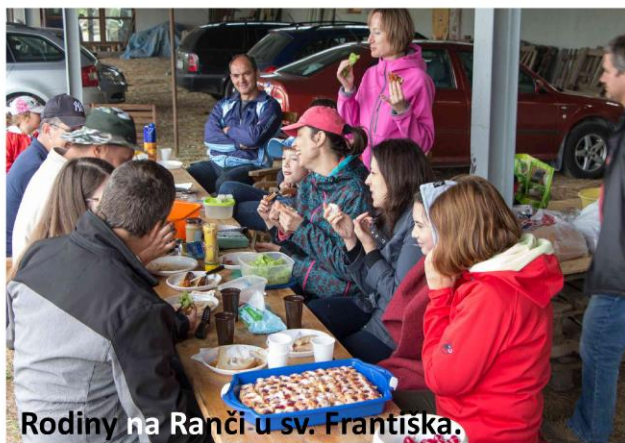
Rodiny na Ranči u sv. Františka.