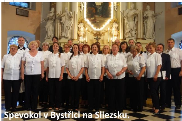
Spevokol v Bystřici na Sliezsku.