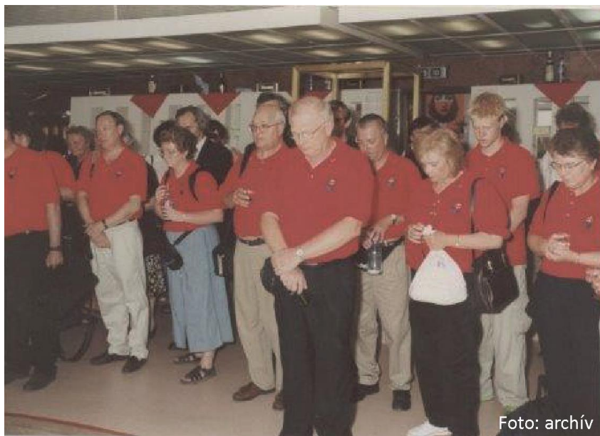
Gene s priateľmi pri posvätení kostola.

V roku 1999 vzniklo partnerstvo medzi cirkevnými zbormi Our Sa-viouřs a Holy Spirit, ako nám oni hovoria podľa názvu nášho Evanje-