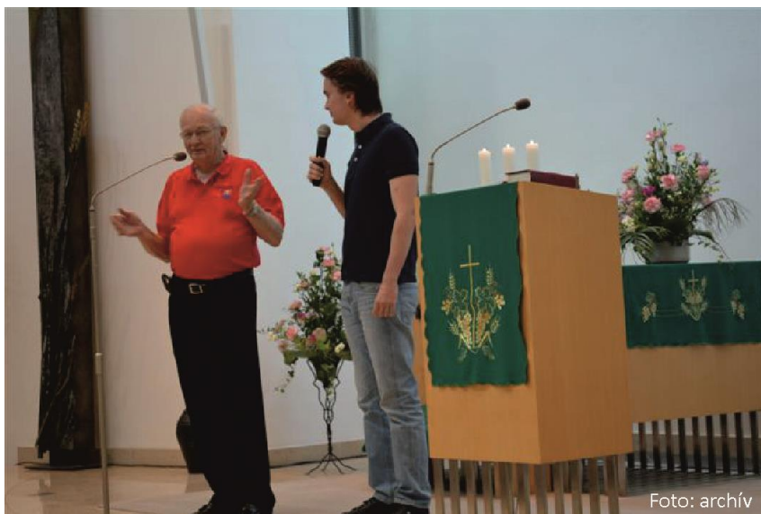
September 2015, posledný Genov pozdrav.