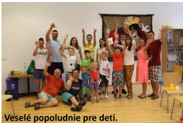
Veselé popoludnie pre deti.