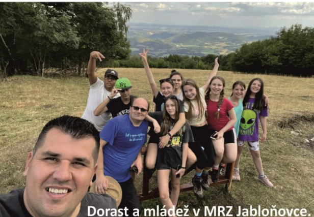
Dorast a mládež v MRZ Jablňovce.