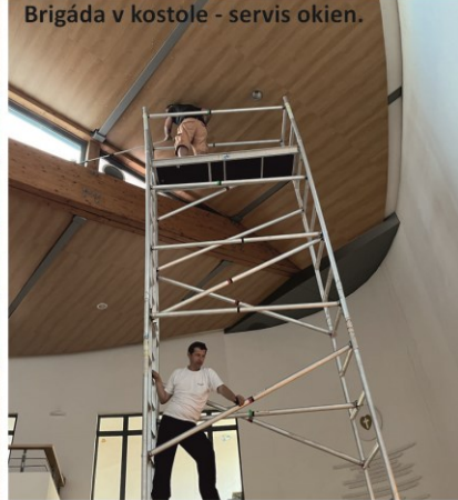
Brigáda v kostole - servis okien.