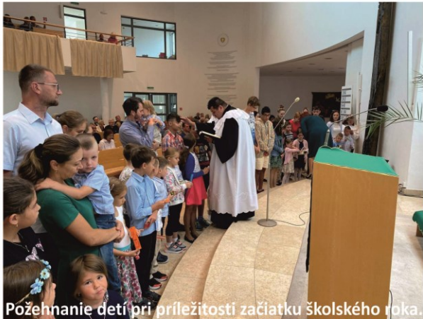
Požehnanie detí pri príležitosti začiatku školského roka.