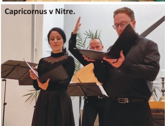
Capricornus v Nitre.