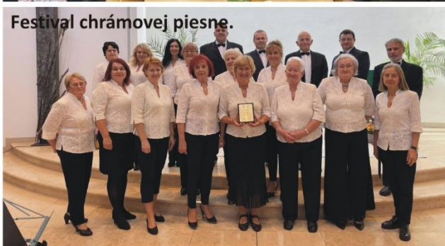
Festival chrámovej piesne.