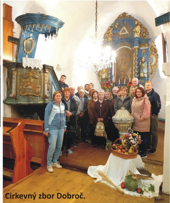
Cirkevný zbor Dobroč.