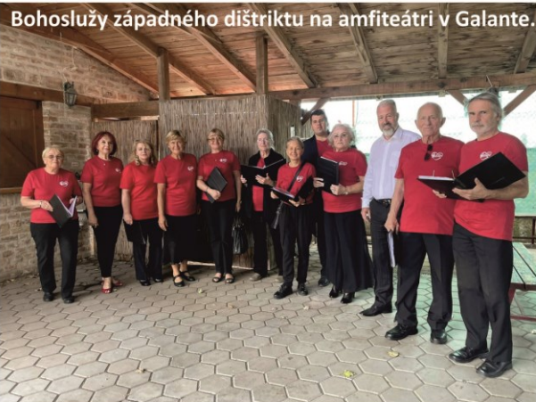
Bohoslužby západného distriktu na amfiteátri v Galante.