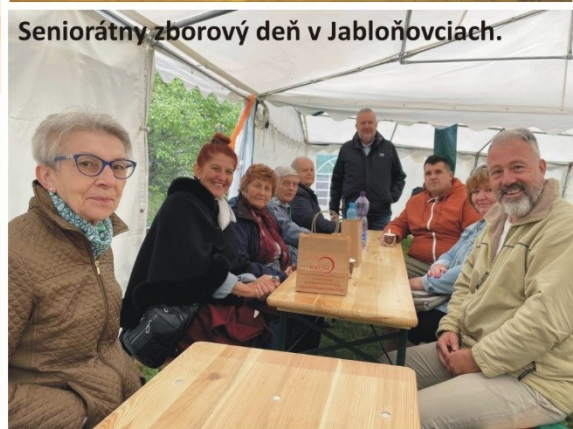
Seniorátny zborový deň v Jablňovciach.