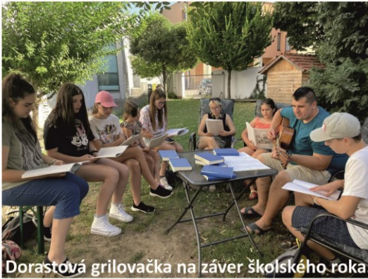
Dorastová grilovačka na záver školského roka.