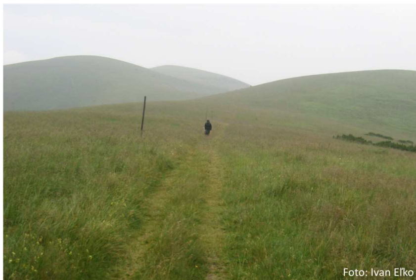
Veriace srdce neľutuje žiaden krok s Bohom.

Svet si niekedy hovorí, že byť kresťanom je jednoduchá, rutinná záležitosť: Chodiť do kostola, modliť sa, dodržiavať pár zvykov. Ak ale človek život viery zoberie vážne, Duch Svätý začne jeho srdcu a svedomiu odkrývať, že vec nie je až taká jednoduchá. Človek objavuje, že byť kresťanom neznamena iba to, že prijmemo nejakú novú von-