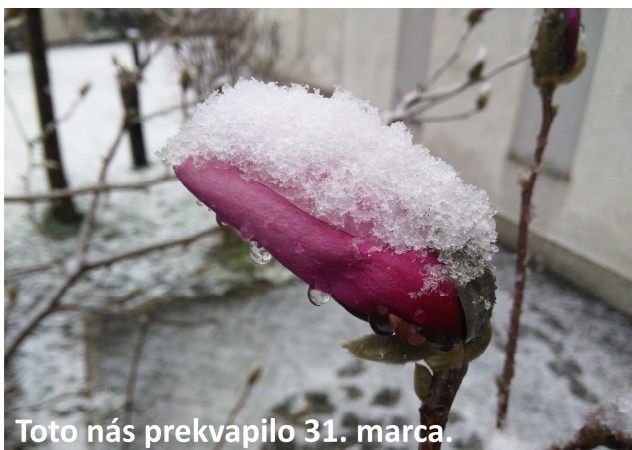
Toto nás prekvapilo 31. marca.