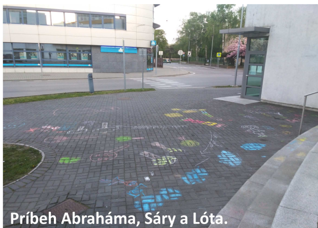
Príbeh Abraháma, Sára a Lóta.