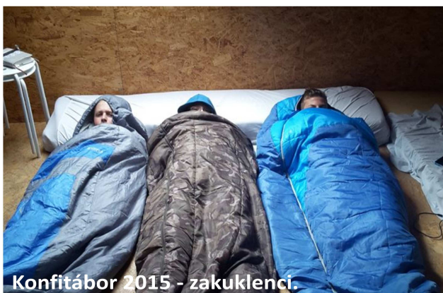
Konfitábor 2015 - zakuklenci.