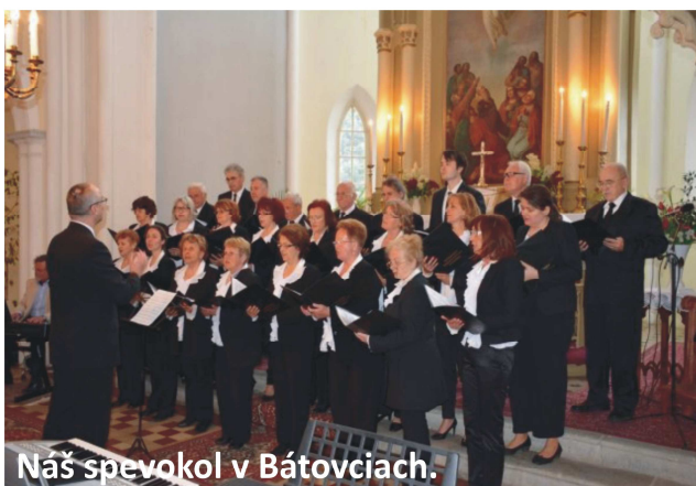
Náš spevokol v Bátovciach.