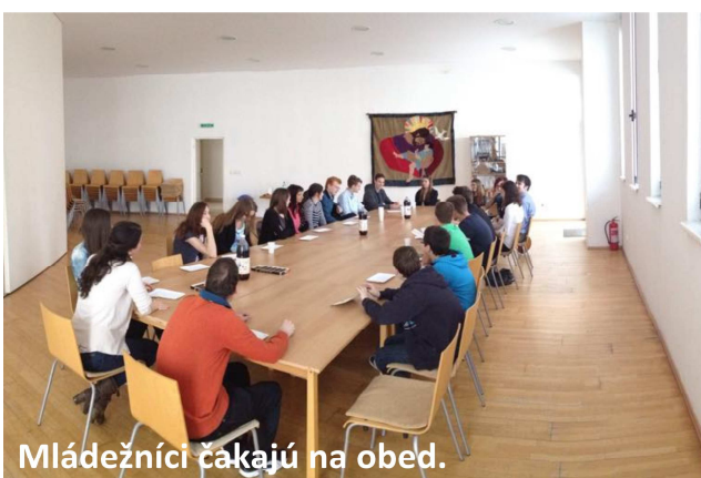
Mládežníci čakajú na obed.