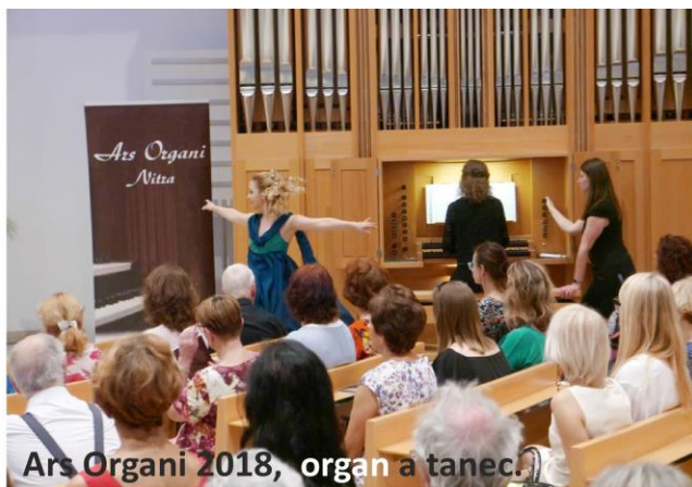
Ars Organi 2018, organ a tanec.