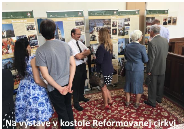
Na výstave v kostole Reformovanej cirkvi