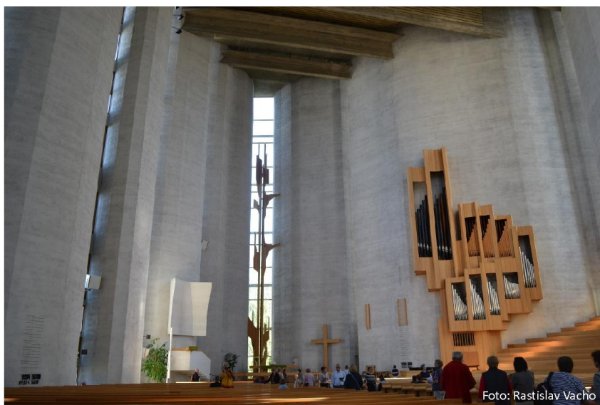
„Nalomenú trstinu nedolomí a tlejúci knôť neuhasí.“ Mt 12,20. Moderný evanjelický kostol v Tampere.

O architektonických detailoch a ich biblických súvislostiach sme mohli rozmýšľať aj pri návšteve tamperskej katedrály mestského