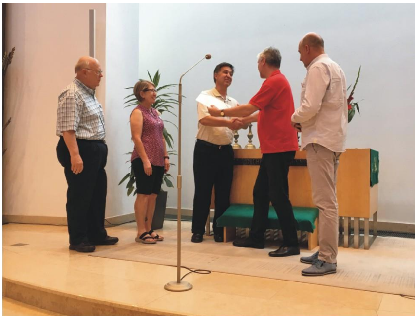
Jún 2018, návšteva z Naperville.