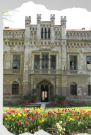
Galanča Amfiteáter 10. 9. 2022