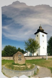
Kremnické Bane Stred Európy 18. 6. 2022