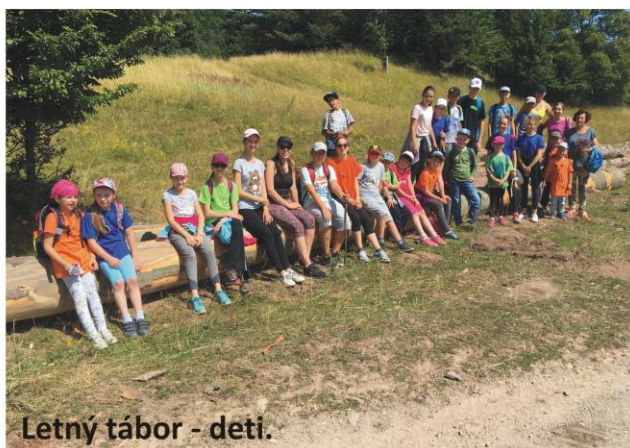
Letný tábor - deti.