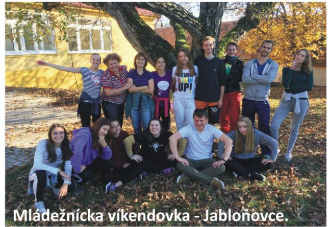
Mládežnícka víkendovka - Jabloňovce.