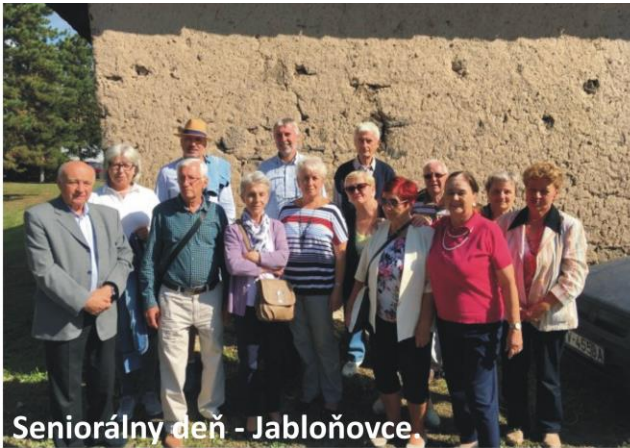
Seniorálny deň - Jabloňovce