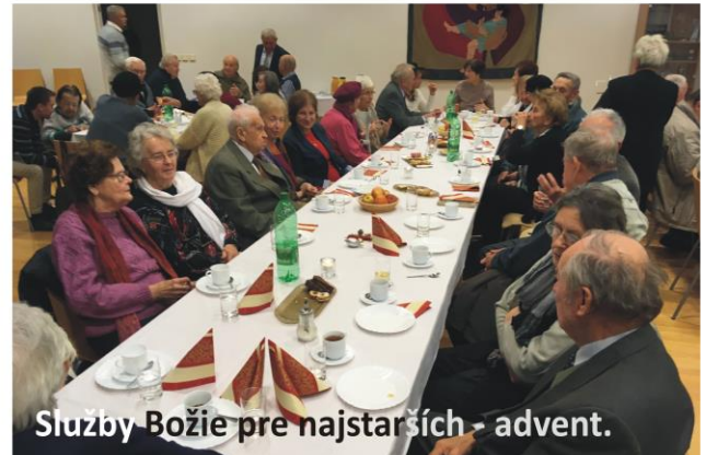
Služby Božie pre najstarších - advent.