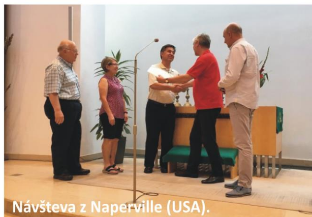
Návšteva z Naperville (USA).