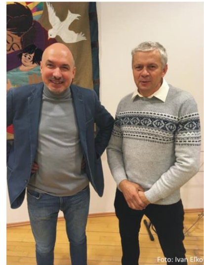
Diakonia v dobrých rukách.

Tiež by som chcel poďakovať všetkým tým, ktorí sa v r. 2018 zapojili do dobrovoľnej diakonickej práce na rozličnej úrovni a v rozličnom rozsahu, keď sa zaujímali o našich klientov či o seniorov vo svojom okolí a boli ochotní nejakú pomôcť. Poďakovanie patrí i celému cirkevnému zboru, zborovému presbyterstvu na čele s bratmi farárom a zbor. dozorcom. Poďakovať však chcem predovšetkým našim klientom za to, že nás prijali a stali sme s súčasťou ich každodenného života .