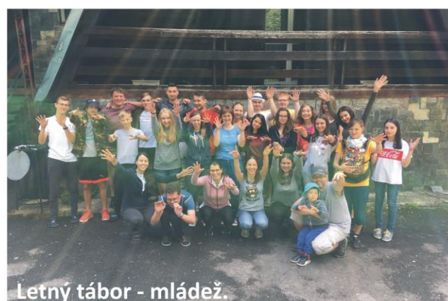
Letný tábor - mládež.