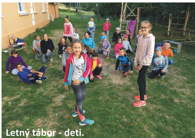
Letný tábor - deti.