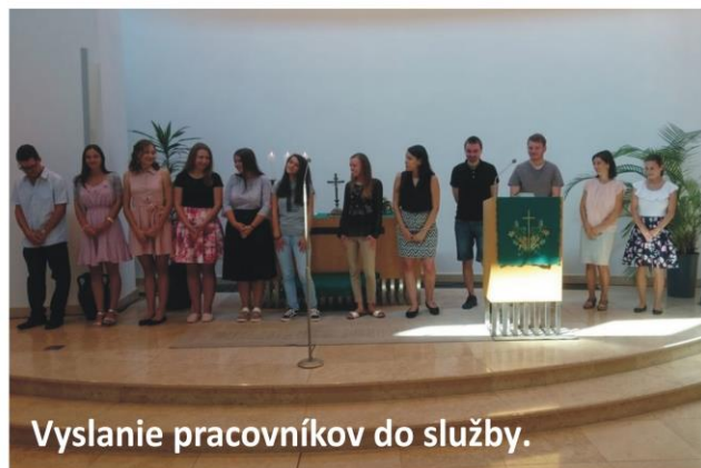
Vyslanie pracovníkov do služby.