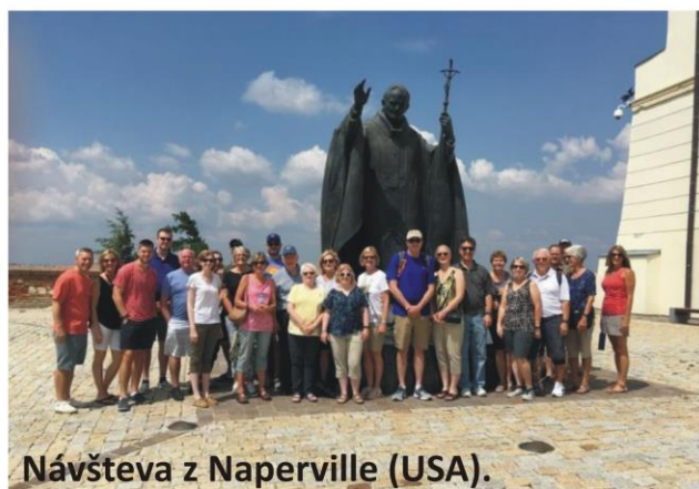
Návšteva z Naperville (USA).