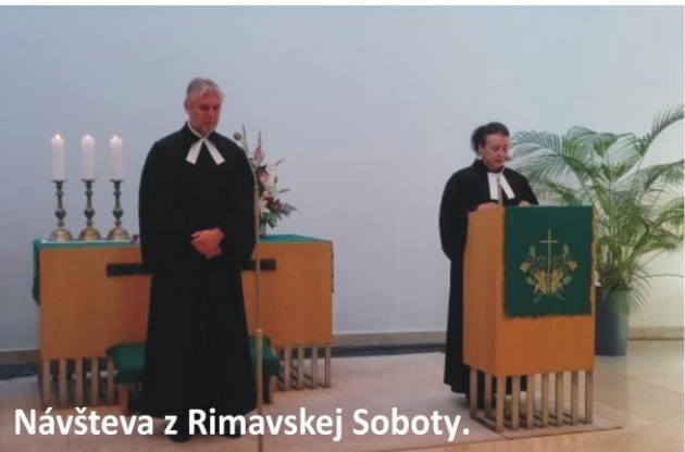
Návšteva z Rimavskej Soboty.