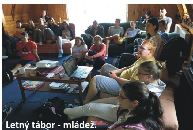
Letný tábor - mládež.