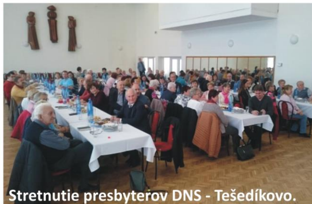
Stretnutie presbyterov DNS - Tešedíkovo.