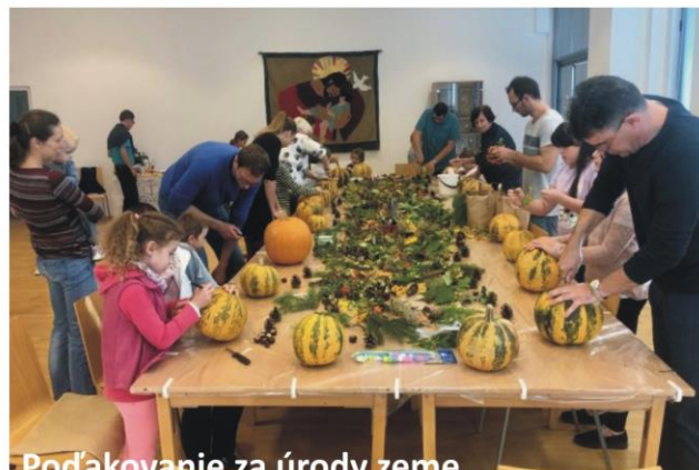
Podakovanie za úrody zeme.