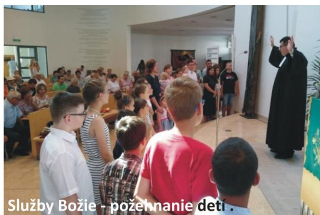
Služby Božie - požehnanie detí.