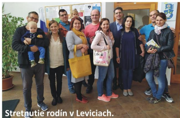
Stretnutie rodín v Leviciach.