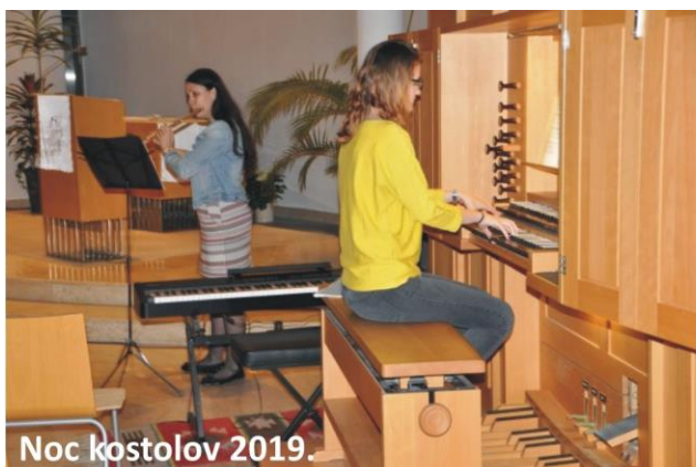
Noc kostolov 2019.