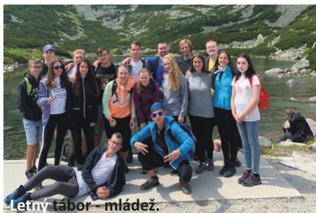
Letný tábor - mládež.