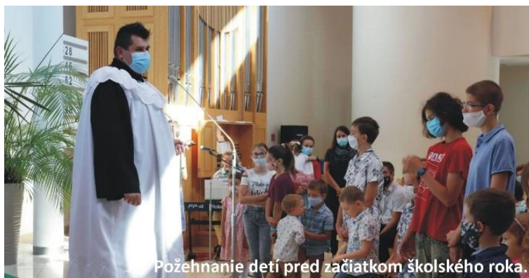
Požehnanie detí pred začiatkom školského roka.