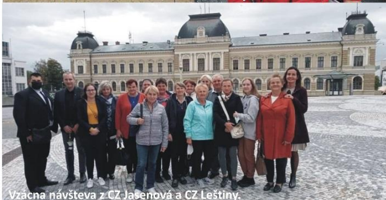
Vzácná návšteva z CZ Jasenová a CZ Leštiny.