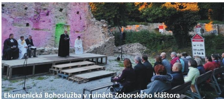
Ekumenická Bohoslužba v ruinách Zoborského kláštoru