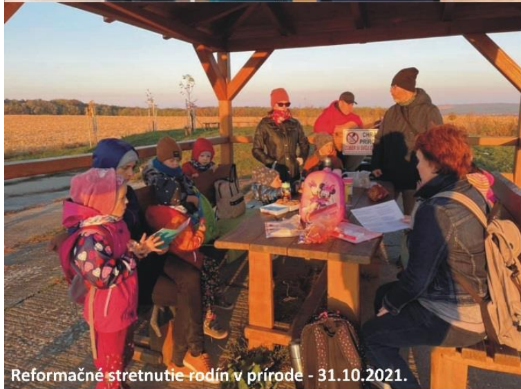
Reformačné stretnutie rodín v prírode - 31.10.2021.