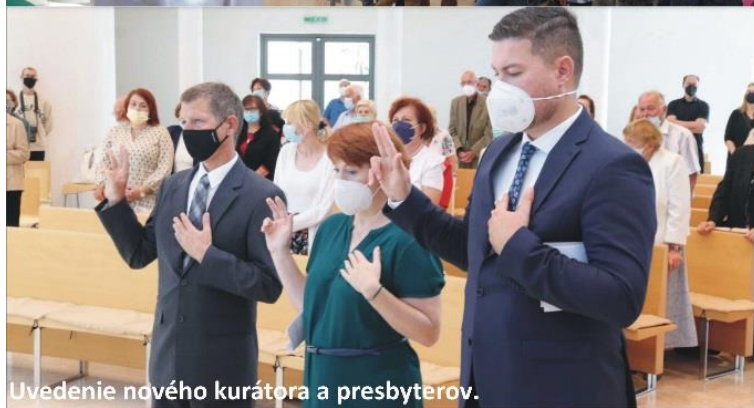
Uvedenie nového kurátora a presbyterov.