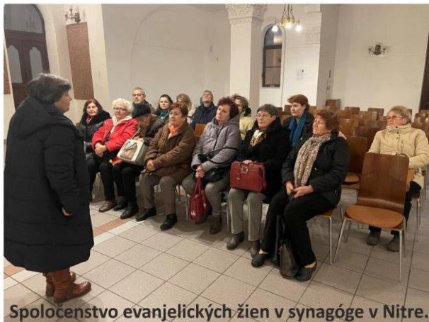
Spoločenstvo evanjelických žien v synagóge v Nitre.