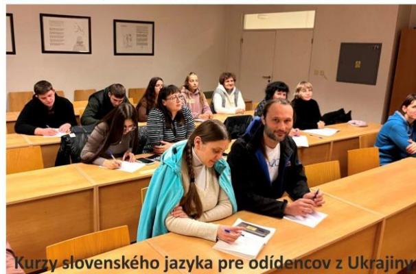
Kurzy slovenského jazyka pre odíedencov z Ukrajiny