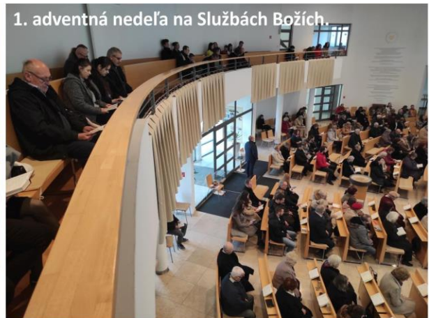
1. adventná nedeľa na Službách Božích.