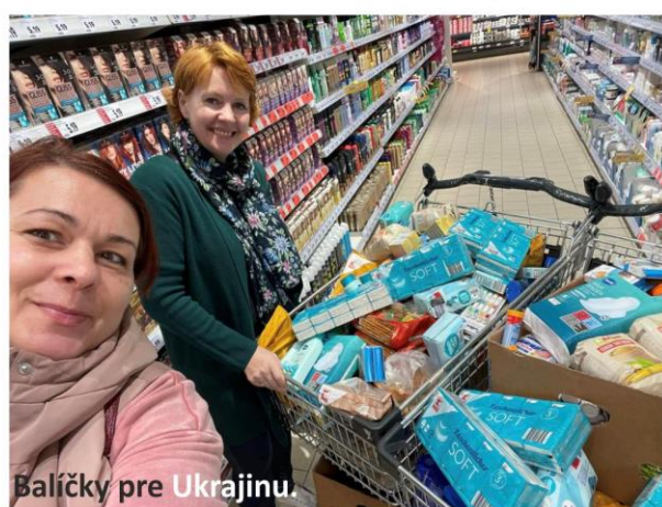
Balíčky pre Ukrajinu.