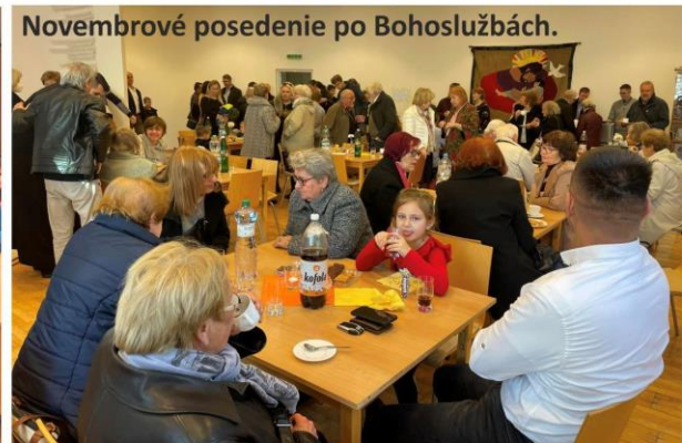
Novembrové posedenie po Bohoslužbách.