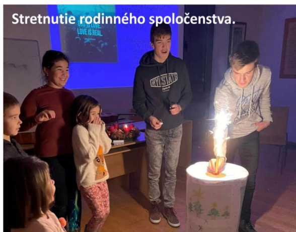
Stretnutie rodinného spoločenstva.