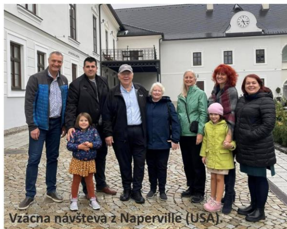
Vzácná návšteva z Naperville (USA).