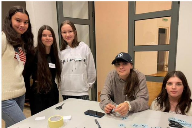
Seniorátne stretnutie konfirmantov a mládeže DNS.