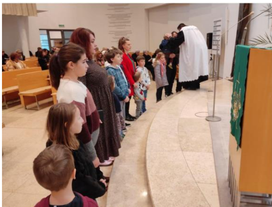
Posledná nedeľa cirkevného roka v našom CZ.