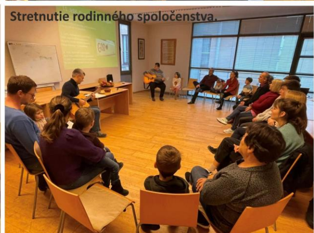
Stretnutie rodinného spoločenstva.