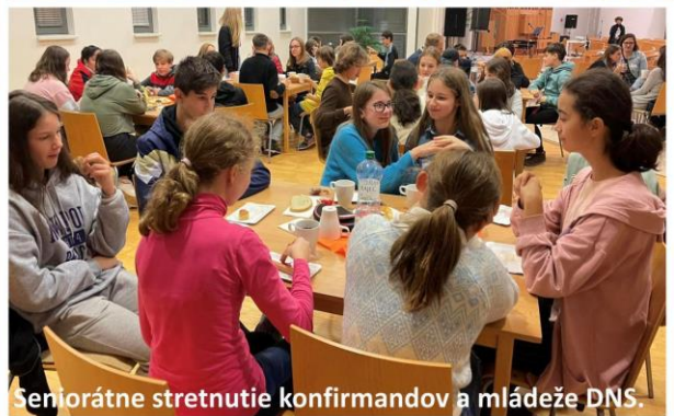
Seniorátne stretnutie konfirmandov a mládeže DNS.