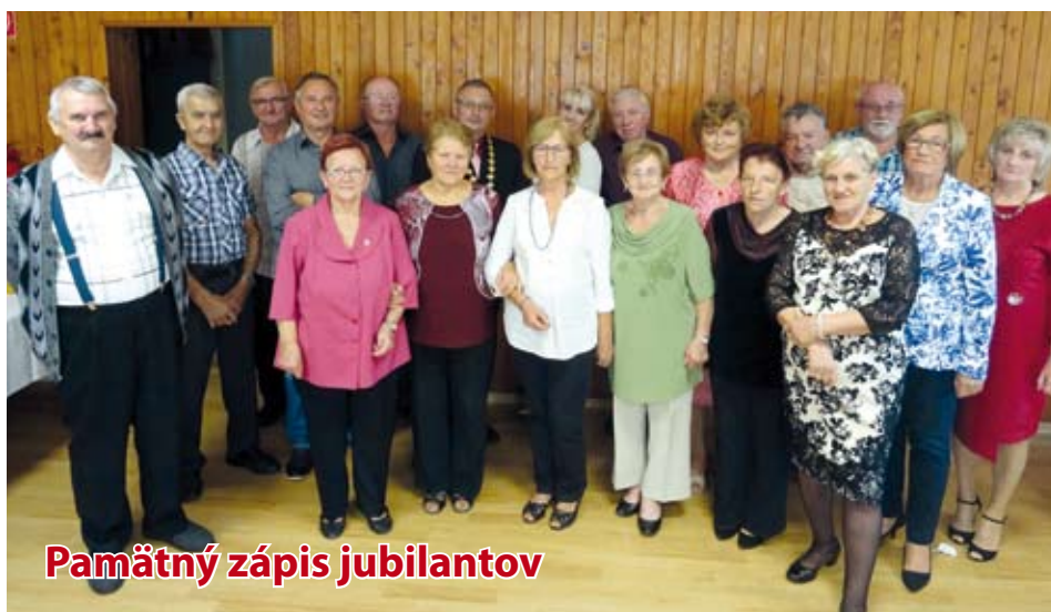
Pamätný zápis jubilantov